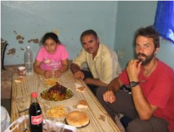
În mijlocul Saharei Occidentale în sînul unei familii marocane