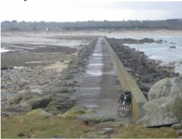
Singurătatea Finisterului, la capătul lumii!