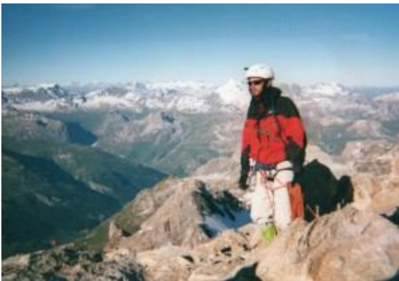
Vice campion al Franței la orientare – 2003