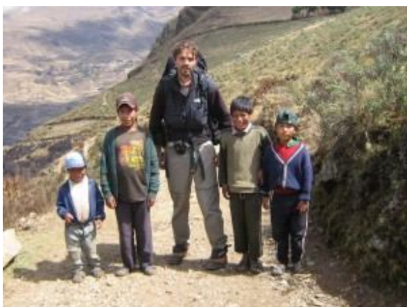
În mijlocul copiilor de țărani munteni din Bolivia