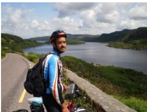
Imagine din Irlanda (2009)

POVEȘTEA UNUI TÂNĂR CARE ȘI-A ÎNVINS BOALA ȘI HANDICAPUL PSIHOMOTOR PRIN PRACTICAREA TURISMULUI PE BICICLEȚĂ DIN BREST ÎN NEPAL – CU BICICLEȚA – 20.000 DE KILOMETRI